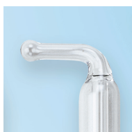
Sonda n. 4