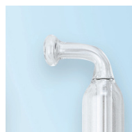
Sonda n. 3