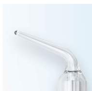
Sonda n. 1