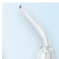
Sonda n. 2