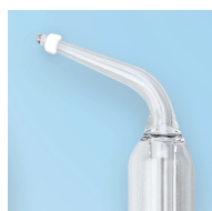
Sonda n. 5