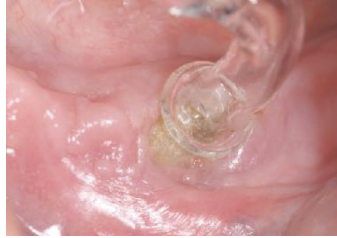
Trattamento di una lesione osteo-necrotica da inibitori di pompa protonica.

La letteratura a supporto del trattamento con ozono delle lesioni osteonecrotiche è corposa e significativa. Le capacità immunostimolanti, antibatteriche, biostimolanti dell'ozono lo rendono particolarmente idoneo alla gestione del trattamento acuto e della prevenzione delle osteonecrosi.