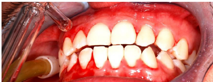
Quadro clinico di gengivite localizzata